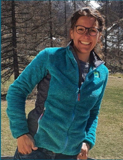
Magali, cuisine & vous accompagne en montagne